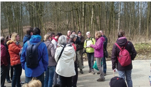
Balad'Eau à Braine-l'Alleud

Cette année, 17 activités étaient proposées sur l'ensemble du sous-bassin de la Senne !