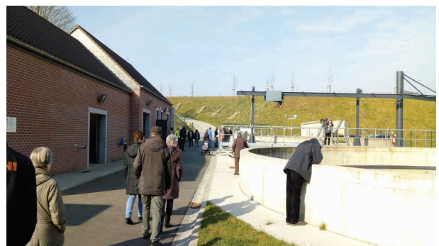
Visite de la station d'épuration à Feluy (Seneffe)

Le Contrat de Rivière Senne tient à remercier tous les partenaires qui s'impliquent chaque année pour les différentes activités proposées lors de ces JWE !