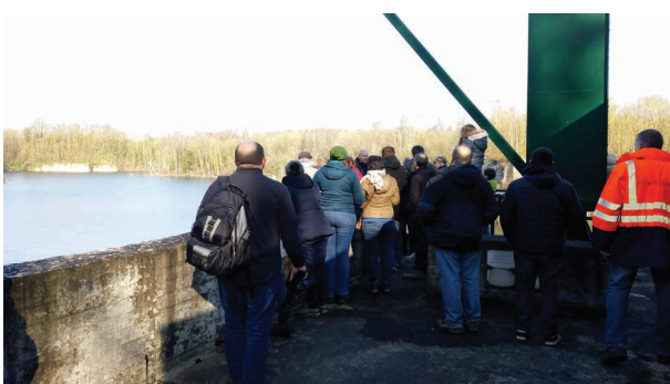
Visite du Trou Goffart à Ecaussinnes

Le Contrat de Rivière Senne tient à remercier tous les partenaires qui s'impliquent chaque année pour les différentes activités proposées lors de ces JWE !