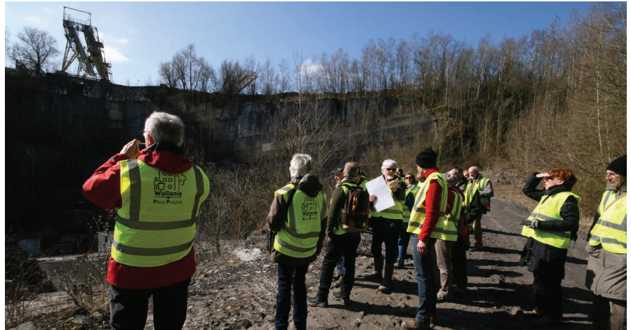
Visite des carrières de pierre bleue Gauthier Wincqz à Soignies