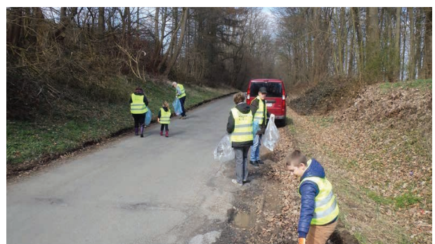
Action BeWapp