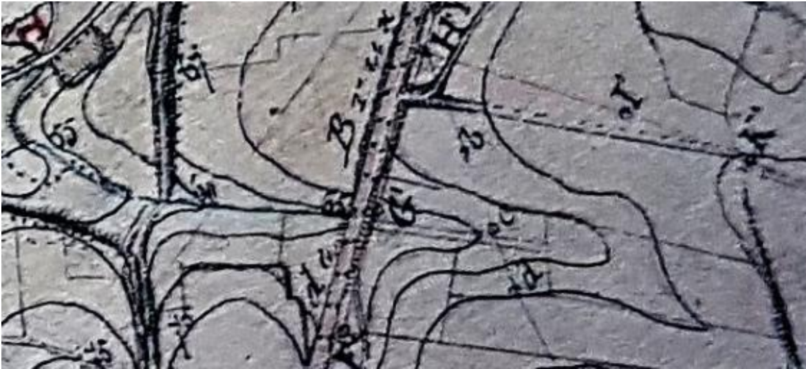
idem sur le plan cadastral de Schaerbeek de 1847

Le plan cadastral de Schaerbeek (1841, collection IGN) est peu lisible en agrandissement, mais grâce aux lignes hypsométriques on voit bien que la chaussée de Louvain traverse une petite vallée (NB que le relief a été fort altéré par l'aménagement des boulevards de la ceinture moyenne dont Reyers)