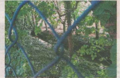
La rivière inaccessible.

Sous l'impulsion de l'échevine auderghemoise, le collège va relayer cette demande auprès des instances qui en ont la charge. Afin de rendre accessible la Woluwe et de remettre en service le « chemin de Woluwe » dans le domaine de Val Duchesse, il a donc été décidé d'interpeller le gouvernement fédéral et la Donation royale, mais également de demander à la Commission européenne, dans le cadre du projet LIFE Belini, de soutenir cette requête auprès du gouvernement fédéral. La majorité invite en outre les autorités communales de Watermael-Boitsfort, Woluwe-Saint-Pierre, Woluwe-Saint-Lambert, Kraainem, Zaventem, Machelen et Vilvoorde à les soutenir.